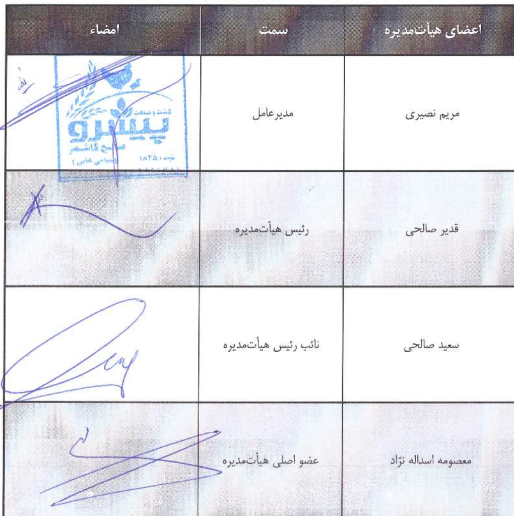
جدول ۱. اعضای هیأت‌مدیره شرکت

این بیانیه در راستای بند (۵) ماده (۱۷) دستورالعمل انتشار اوراق مرابحه به منظور تصمیم‌گیری در خصوص تأمین مالی شرکت کشت و صنعت پیشرو صالح کاشمر (سهامی خاص)، از طریق انتشار اوراق مرابحه برای خرید قطعات مورد نیاز جهت احداث نیروگاه خورشیدی تولید برق با ظرفیت ۶،۰۰۰ کیلو وات، به وسیله شرکت واسط مالی پیشرو (با مسئولیت محدود) به عنوان ناشر اوراق تهیه شده و در تاریخ ۱۴۰۳/۰۶/۱۸ به تأیید هیأت‌مدیره شرکت کشت و صنعت پیشرو صالح کاشمر (سهامی خاص)، رسیده است.