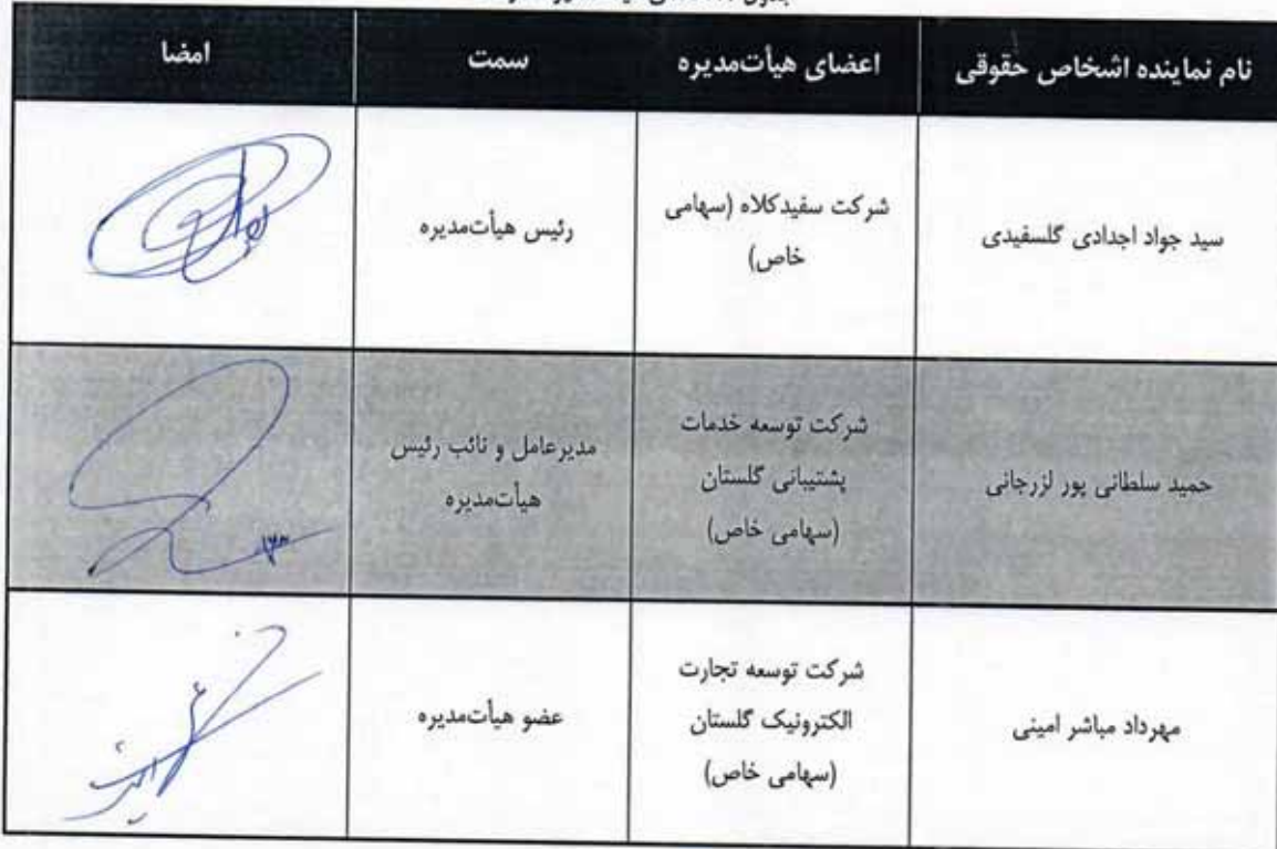
جدول ۱. اعضای هیأت‌مدیره شرکت

این بیانیه در راستای بند (۵) ماده (۲۷) دستورالعمل عرضه خصوصی اوراق مرابحه کوچک و کوتاه مدت به منظور تصمیم‌گیری در خصوص تأمین مالی شرکت گلستان (سهامی خاص)، از طریق عرضه خصوصی اوراق مرابحه کوچک و کوتاه مدت برای خرید مواد اولیه مورد نیاز، به وسیله شرکت واسطه مالی ..... (با مسئولیت محدود) به عنوان ناشر اوراق تهیه شده و در تاریخ ۱۳۰۴/۰۲/۱۳ به تأیید هیأت‌مدیره شرکت گلستان (سهامی خاص)، رسیده است.